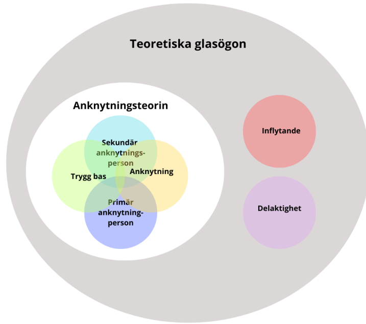
Figur 2: Illustration som visar hur mina teoretiska glasögon samspelar mellan teorin och begrepp (Älvedal, 2025)