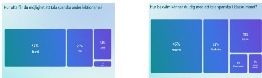
Figur: 10 – 11