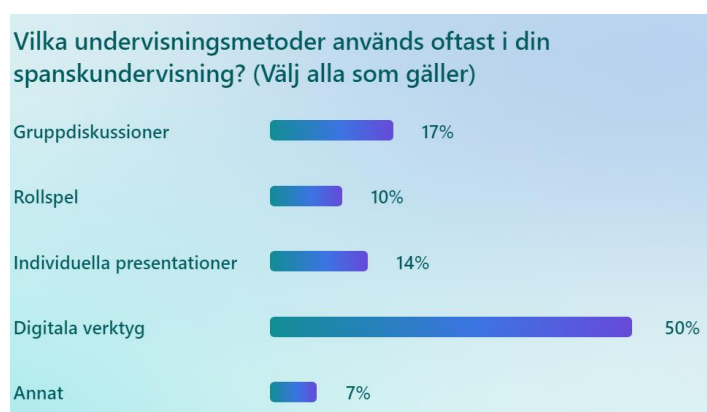
Figur 9: Förekomst av elevers svar

Svaren i frågan visar att digitala verktyg är den mest populära metoden i spanskundervisning, följt av gruppdiskussioner, individuella presentationer och rollspel. Detta indikerar en trend mot att använda teknologi och interaktiva metoder för att stödja språkinläring. Genom att använda en kombination av dessa metoder kan lärare skapa en rik och varierad lärmiljö som hjälper eleverna att utveckla sina språkliga färdigheter på olika sätt.