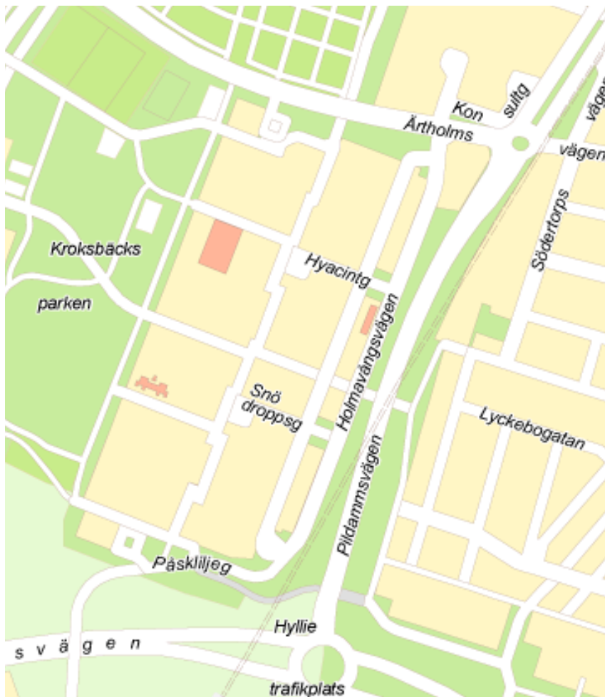
Karta 2. Holma.

människor, och i Områdesprogrammet spekuleras kring om detta kan vara en anledning till att området är socialt instabilt (Malmö stad 2011, Områdesprogrammet Holma-Kroksbäck ). Holma är ett av de bostadsområden i Malmö som karaktäriseras som ett problemområde drabbat av narkotikahandel, skadegörelse och fall av skottlossningar. Ändå kan man skönja ett engagemang och välvilja hos de boende i området, och önskan att förbättra sitt område (Frosberg & Häggström 2011) och detta är en viktig anledning till att Holma har valts som fokus för föreliggande arbete.