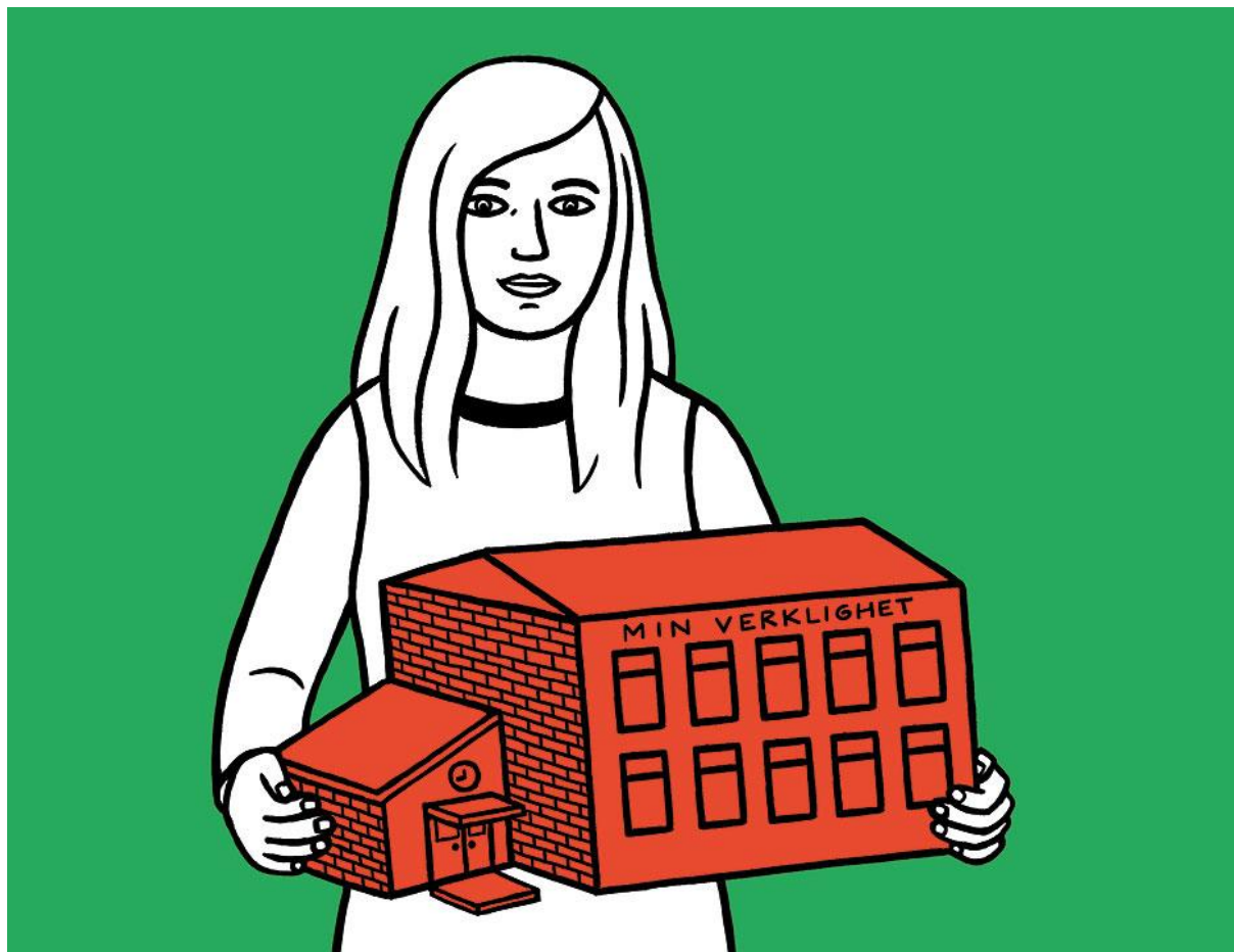
Illustration: Helena Davidsson Neppelberg[/caption]

Synliggör elevernas egna erfarenheter, bygg vidare med upplevelser och verkliga utmaningar kopplat till läroplanen. Så kan lärandet bli meningsfullt för flertalet.